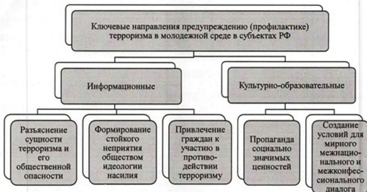
Рисунок 1. Ключевые направления предупреждению (профилактике) терроризма

Перечисленные выше направления реализации Комплексного плана предполагают следующие форматы проведения мероприятий: